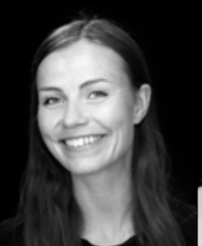
Emília Gísladóttir Island